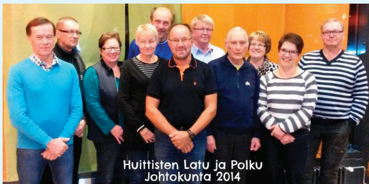
Huittisten Latu ja Polku Johtokunta 2014