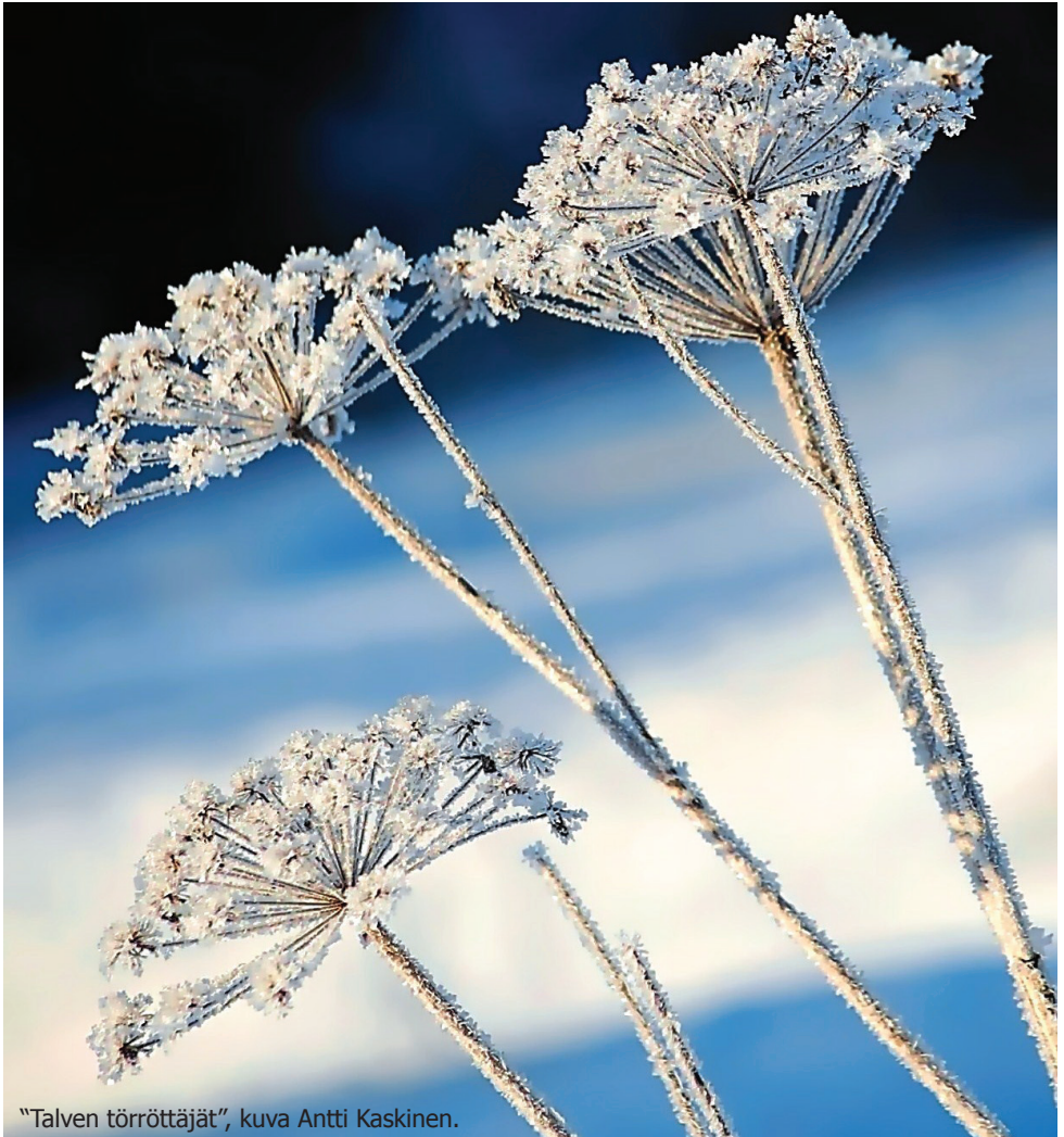
"Talven törröttäjät", kuva Antti Kaskinen.