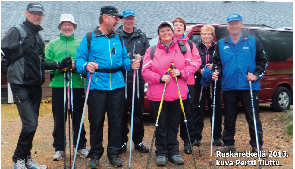
Ruskaretkellä 2013.

Tapahtumista ja muusta toiminnasta ilmoitetaan Lauttakylä-lehdessä sekä yhdistyksen kotisivuilla. Seuraa ilmoittelua ja tule mukaan toimintaan. Yhdessä liikkuminen on hausempaa.